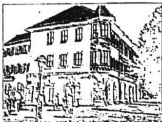
Unsere Hauptstelle ist der Friedrichstraße 8 & 9 in Prenzlau