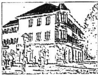
Unsere Hauptstelle ist der Friedrichstraße 8 & 9 in Prenzlau